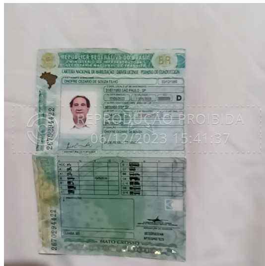
official_document_front_06 dez 2023, 15-41-37.png

Foto da frente do documento oficial com hash SHA256 prefixo b912a3(...)