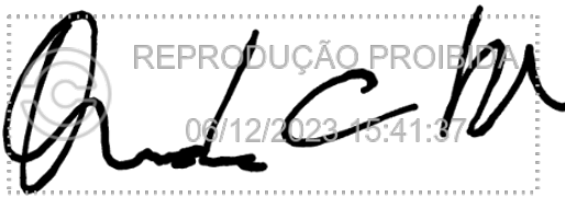
Onofre Cezário de Souza Filho 06 dez 2023, 15-41-37.png

Assinatura manuscrita com hash SHA256 prefixo bde53a(...)